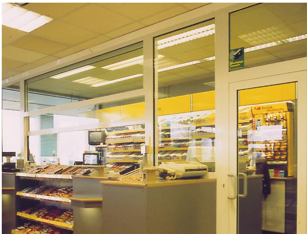
Protection contre les attaques à main armée.