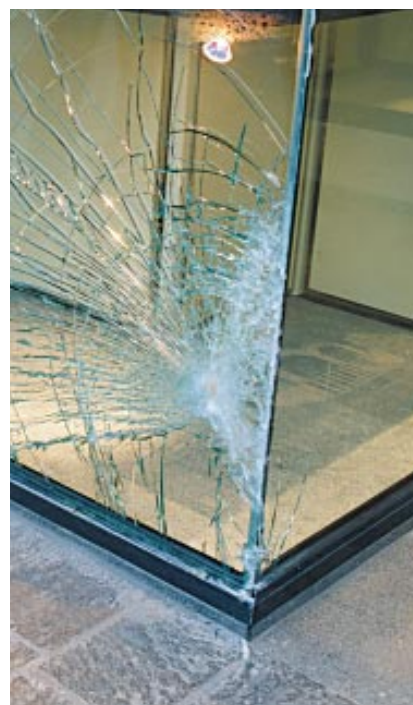
Protection contre les attaques à main armée.