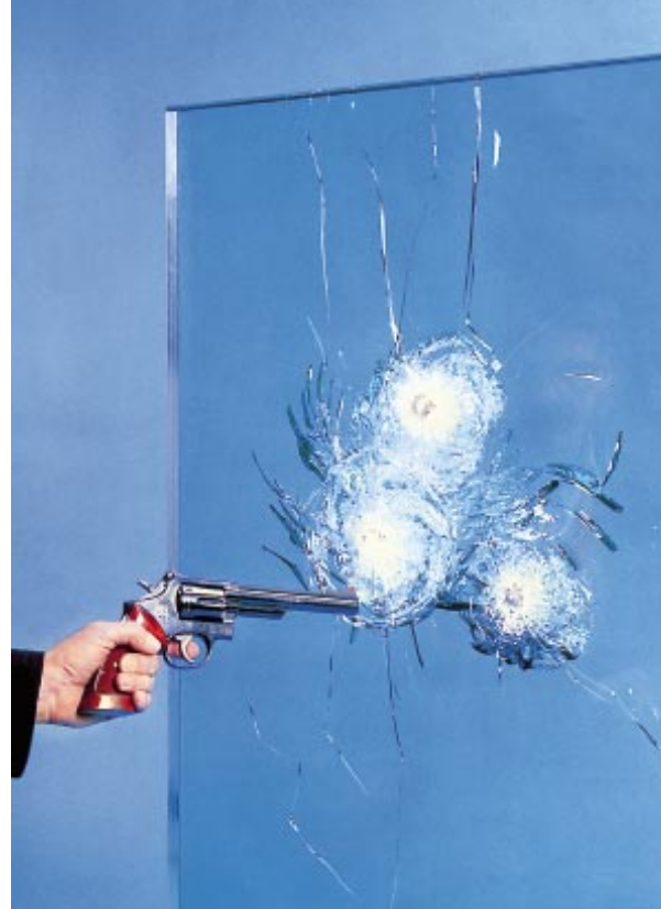
Tableau 3 : Norme NBN-EN 356 (Résistance à une attaque manuelle)